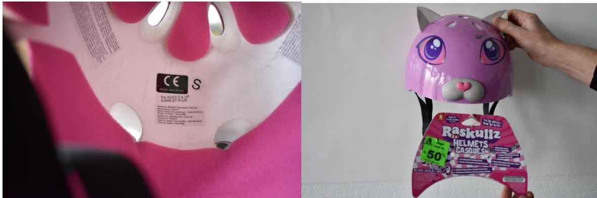
Figure 2 : Marquage du casque, signifiant qu'il est bien conforme à la norme EN1078 et identification du casque.