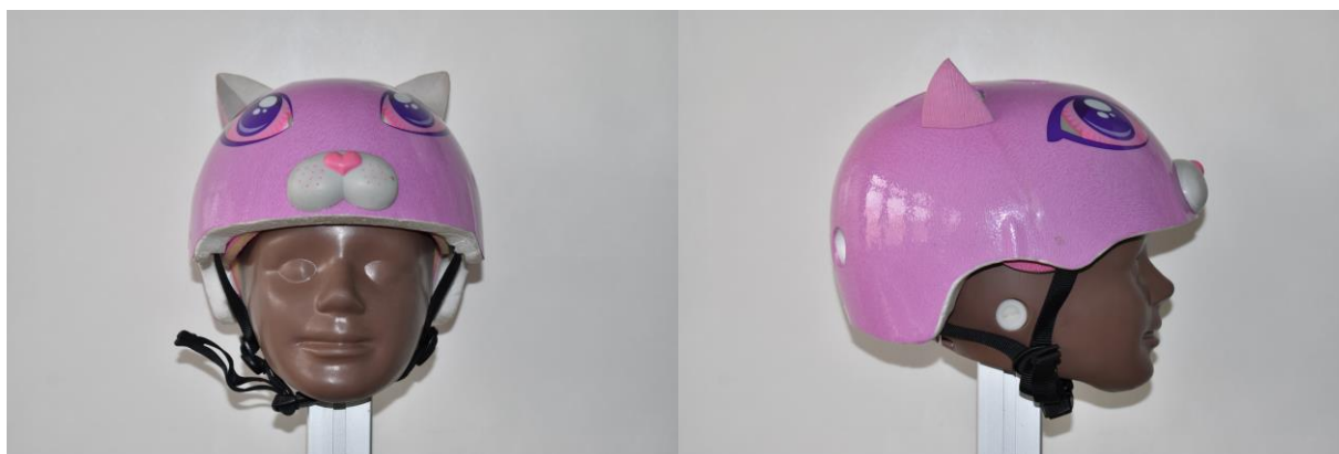
Figure 1 : Illustration du casque Raskullz pourvu de décorations sous la forme d'oreilles rigidement fixées au casque.

Au total la norme actuelle n'est pas capable d'écartier ce type de casques et il semble opportun d'informer le public sur le potentiel danger de ces aspérités en attendant l'évolution de la norme.