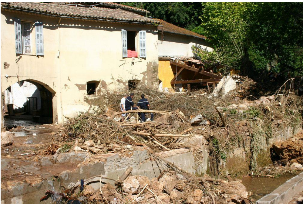
Figure 2 : Les Arcs sur Argens en 2010.