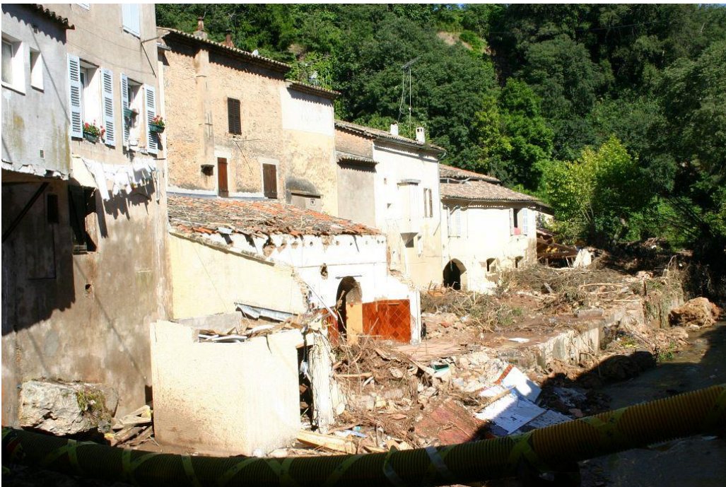
Figure 1 : Les Arcs sur Argens - dégâts suite à la crue et aux inondations 2010.

Diverses politiques existent pour faire face au risque d'inondation : des mesures structurelles (digues, barrages) ou non-structurelles (bassins de rétention des eaux) peuvent réduire les conséquences de l'aléa. Les politiques de compensation (le système CatNat en France) et des contrats d'assurance privée peuvent améliorer la résilience des personnes touchées. Des politiques de zonages et d'information peuvent prévenir la population et réduire leur vulnérabilité. Ainsi, les ménages peuvent opter pour éviter les zones à risque, s'ils le souhaitent.