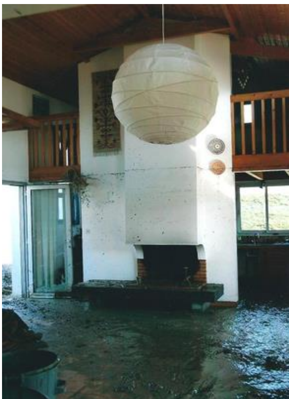
Figure 2 : Maison inondée.

Le groupe de personne qui ne reçoit aucune information additionnelle (groupe 1) exprime un CAP à hauteur de 79 000 €.